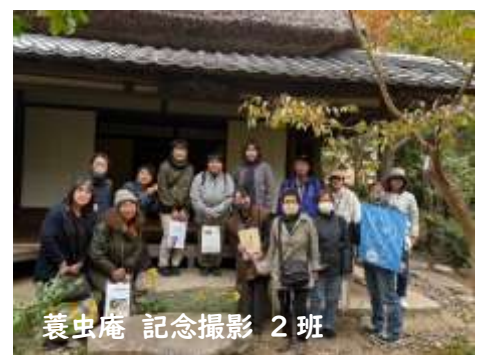
蓑虫庵 記念撮影 2班