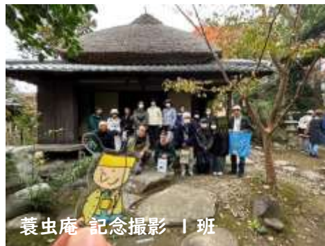
蓑虫庵 記念撮影 1班