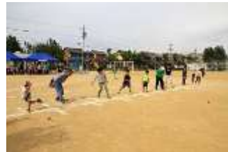
ローリングボール