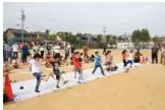
フライングスリッパ