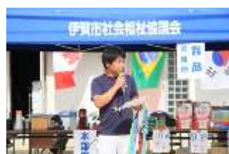
大会委員長の競技宣言