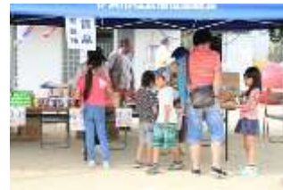
おはじきで賞品と交換