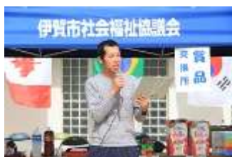
競技委員長から競技の説明