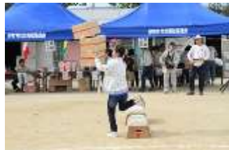
山こえ！谷こえ！宅配レース