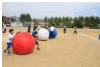
大玉ころがしリレー