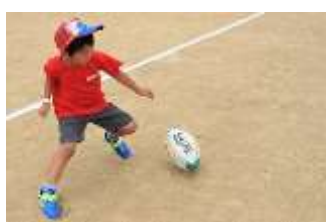
KICK & TRY