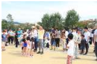
上野南部ウルトラクイズ