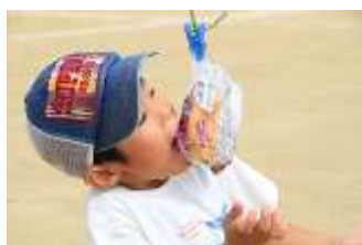
おめざ パン食い競争

当日は天候に恵まれ、早朝より実行委員の皆様による準備が整い、参加者が次々とおとずれ、受付時にくじで渡されたリストバンドで、赤・白・青・黄の4組に分かれ、組対抗戦や全員が参加できる競技が行われました。