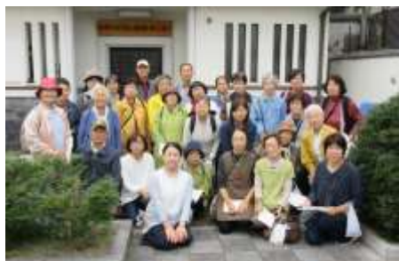
東日南町溝川地蔵横消防ポンプ庫前