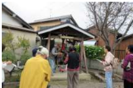
一願地蔵地尊（鉄砲町）