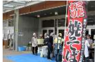
女性部による焼きそば