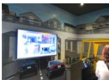
アンダーパスの様子