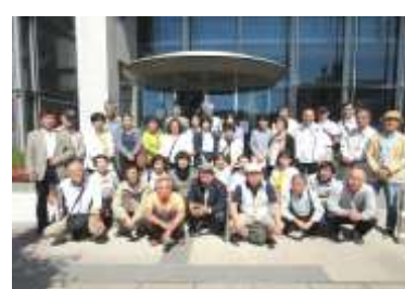
女性部会・防災部会・自治会部会みなさん