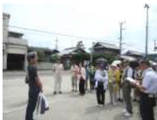
到着時、語り部さんと

現地では、語り部さんの案内で3班に分かれて「真田庵」「真田古墳」「旧萱野家」「対面石」「真田ミュージアム」「慈尊院」を散策しました。