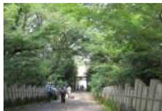
丹生官省符神社(世界遺産)