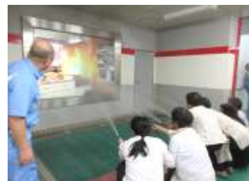
水消火器訓練の様子