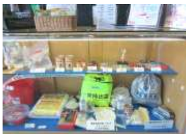
非常持ち出し用品例