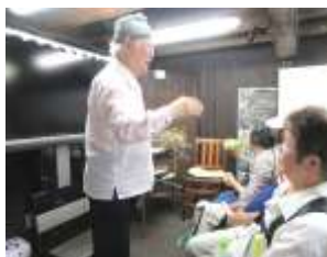
旧萱野家(大石順教尼の記念館)